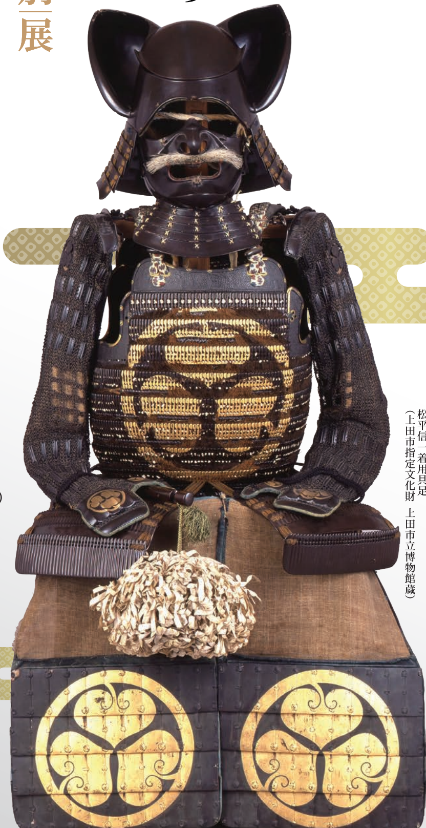
松平信一着用具足 (上田市指定文化財 上田市立博物館蔵)