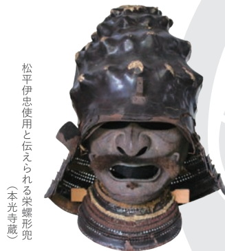
松平伊忠使用と伝えられる栄螺形兜(本光寺蔵)